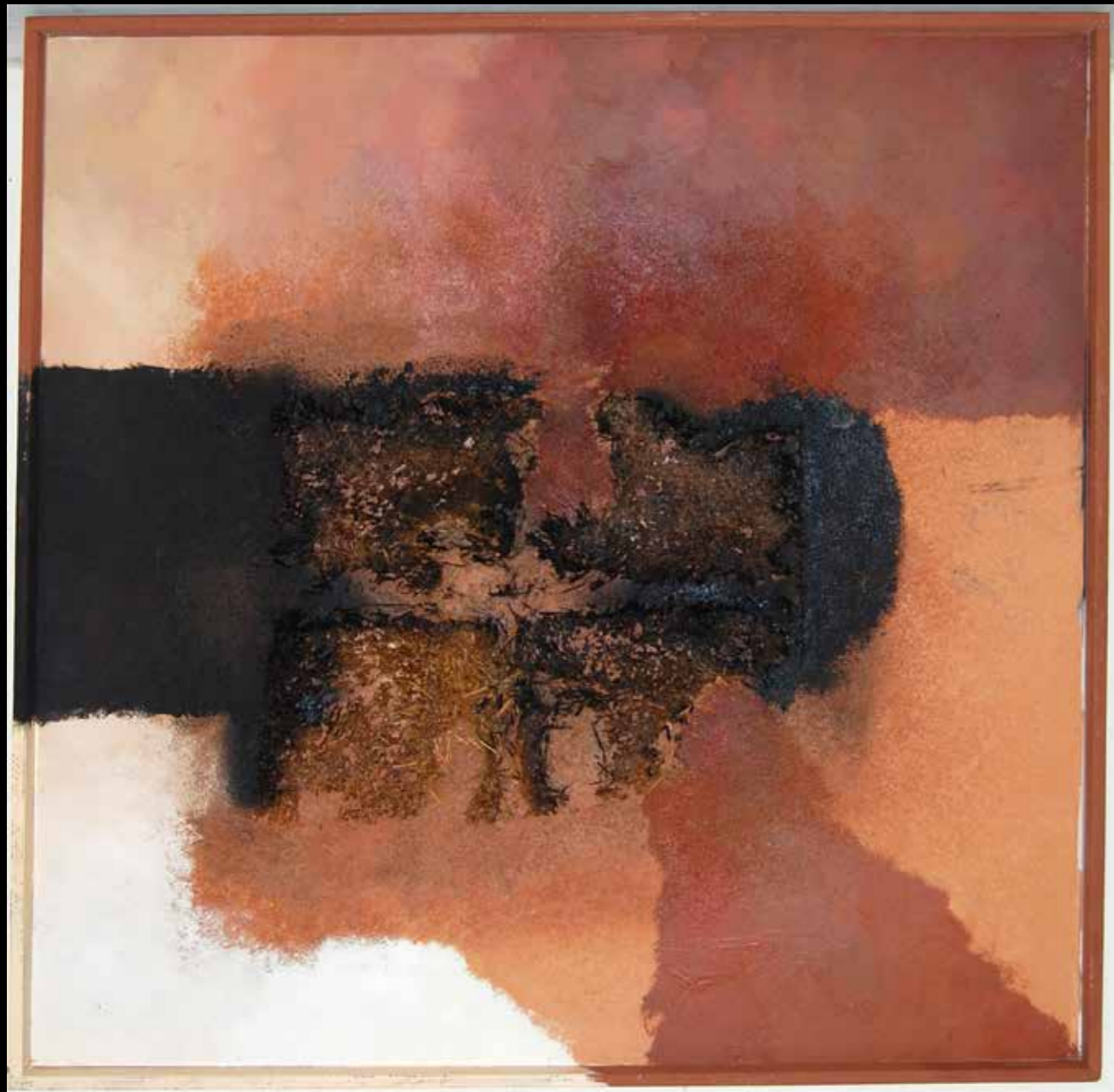
Terra i rostoll 121x121 - Mixta sobre madera 2003