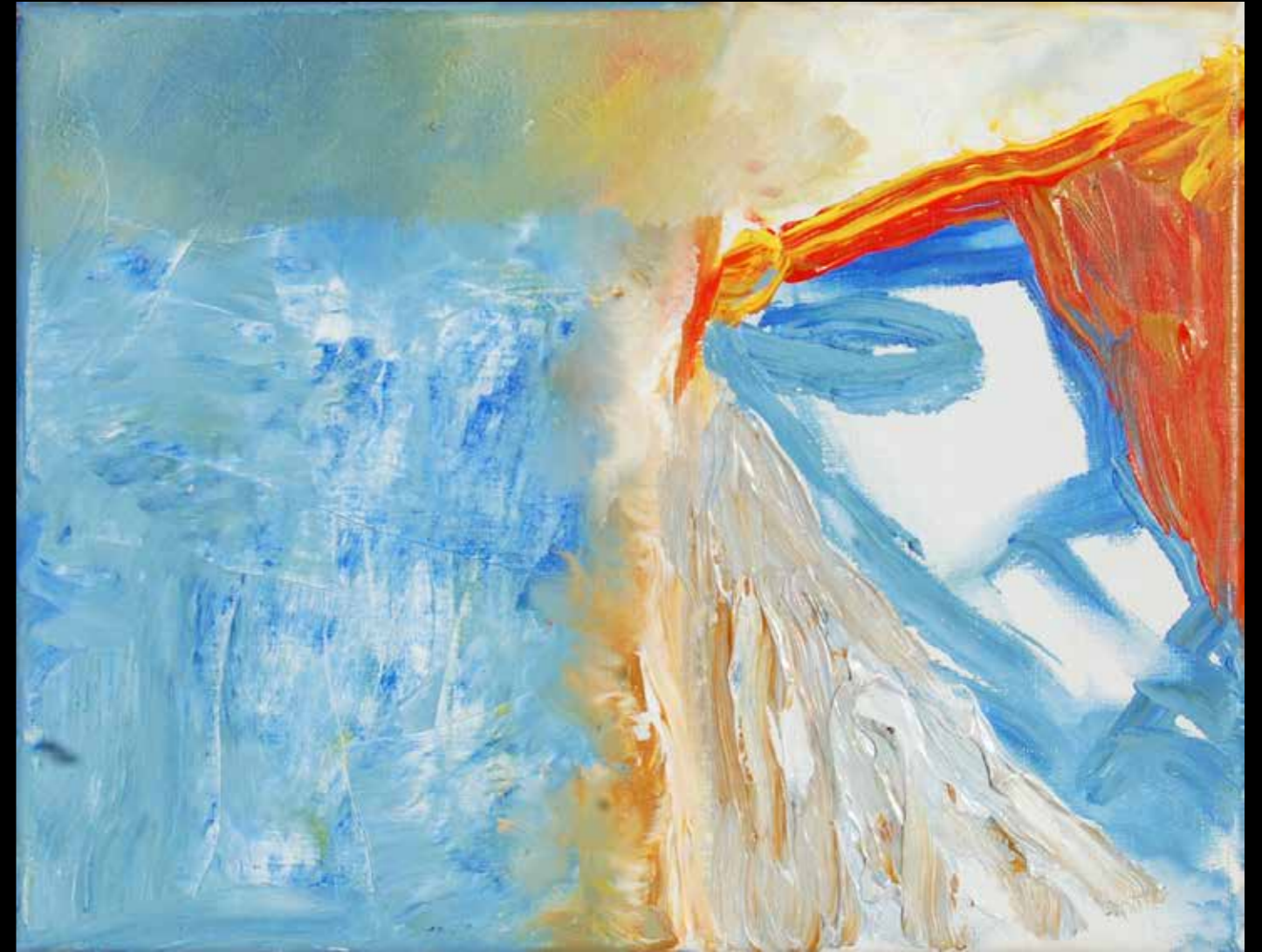
NIT I MATÍ 27x37 - Mixta sobre tela 2002