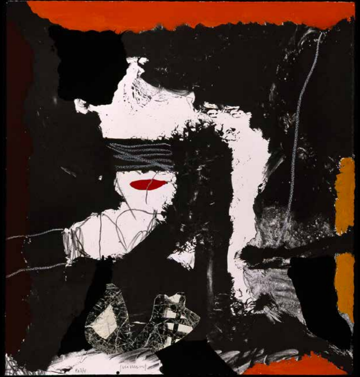
León Felipe 47x70 - Litografía iluminada a mano con collage 1993