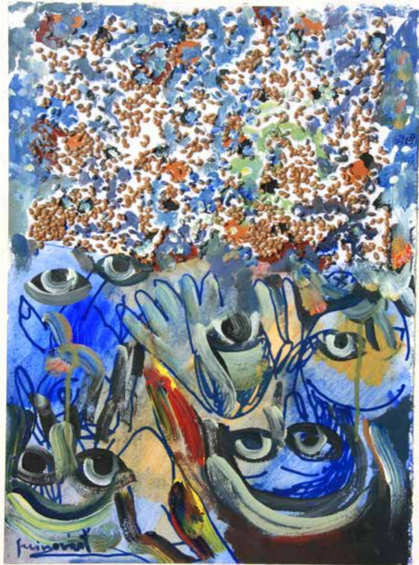
Sin Título 50x35 - Mixta sobre papel con collage