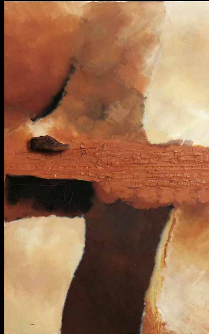
Petita forma de futur 162x100 - Mixta sobre tela 2005